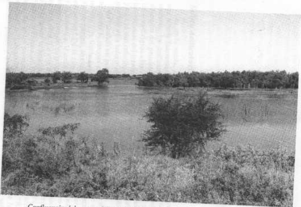
Confluencia del arroyo Ubajay con el río Colastiné.