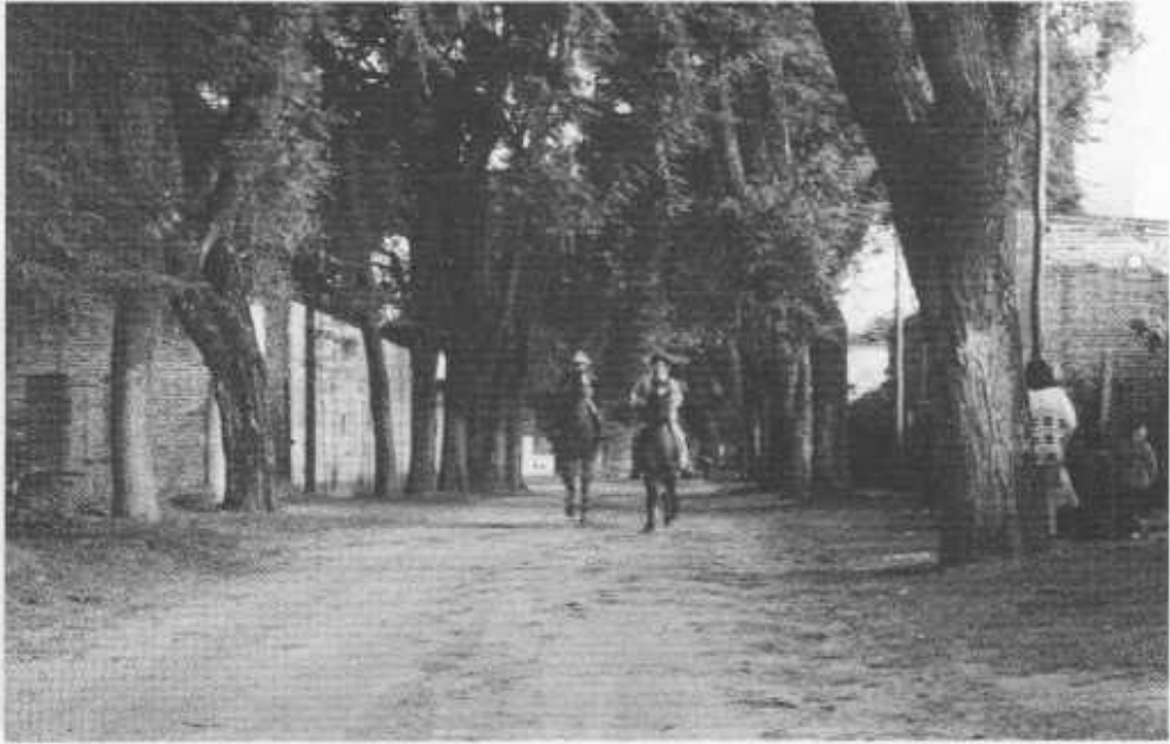
San José del Rincón, Provincia de Santa Fe.